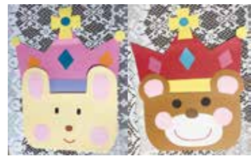
▲手作りのお誕生日カード

お子さんだけでなく、お母さんも応援したいという思いから、その月にお誕生日を迎えるお子さんに手作りのお誕生日カードとプレゼントをお渡ししています。