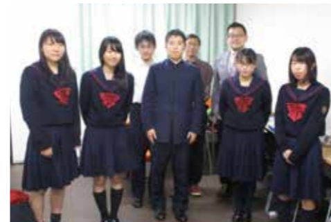
▲横浜隼人高校のみなさん

今では、クラブがない日にもぼかぼかプラザに寄ってくる子どもも増え、地域での子どもの見守りにも役立っています。