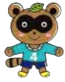
瀬谷第四地区マスコット「よんたくん」

今後は、子どもと高齢者との繋がりが作れるイベントをもっと考えていきたいと思っています。