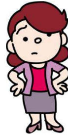
町内会長5年目のBさん

災害時に、高齢者を健康面に配慮しながらサポートするようなシステムを作りたいわ。役所に相談するとしたら、防災の窓口？それとも福祉の窓口？役所は「縦割り」だから、どこに相談すればいいかわからないのよね・・・補助金が出るのかも知りたいわ。