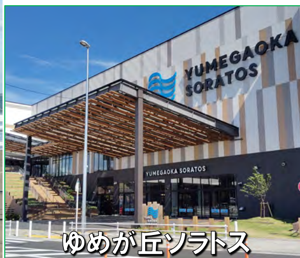
ゆめが丘ソラトス