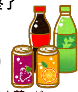
お茶・ジュースなど