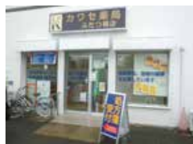
⑦カワセ薬局ふたつ橋店