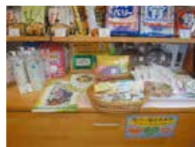
⑦カワセ薬局ふたつ橋店内