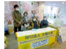
① 瀬谷区役所2階区民ホール

(瀬谷区役所福祉事業所バザー) [開催日] 毎月第2火曜日 / 11時から13時まで 第3火曜日