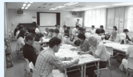
南部地域福祉保健計画策定懇談会の様子