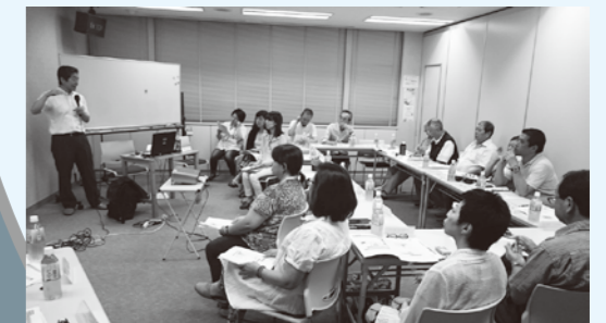
南部地域福祉保健計画策定委員会の様子