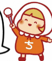
横浜市地域福祉保健計画キャラクター ちふくちゃん

令和7年度は第5期計画策定を進める大切な年だよ！ これからも、瀬谷区がもっと暮らしやすいまちになるよう、みんなで一緒になって地域活動を盛り上げていきましょう！