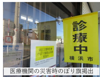
医療機関の災害時のぼり旗掲出