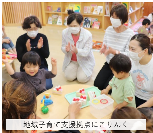
地域子育て支援拠点にこりんく

栄区の青少年の豊かな心を育むため、青少年が主体的に企画に携わり地域との交流を創出する文化芸術活動等を支援します。