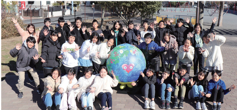
笠間小学校の児童とGREEN×EXPO 2027公式マスコットキャラクター トウンクトゥンク