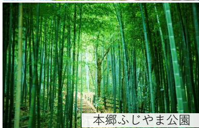
本郷ふじやま公園