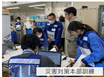
災害対策本部訓練