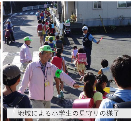
地域による小学生の見守りの様子