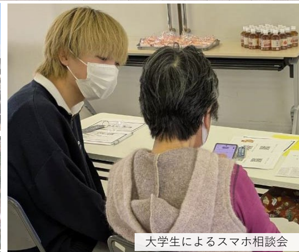
大学生によるスマホ相談会