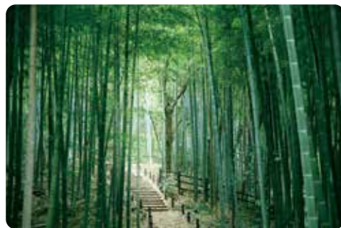
本郷ふじやま公園