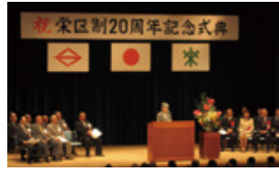
栄区制20周年記念式典