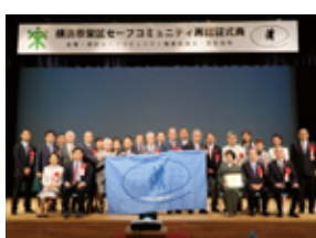
セーフコミュニティ再認証式典