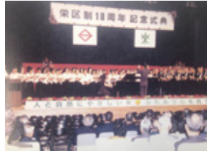
栄区制10周年記念式典