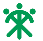
栄区のシンボルマーク

「中野地域ケアプラザ」及び「SELP.社」の開設(4月)。「荒井沢市民の森」開園(5月)。