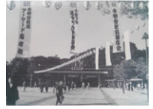
本郷台駅前 (1986年当時)