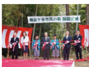
鍛冶ヶ谷市民の森