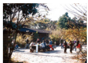
横浜自然観察の森