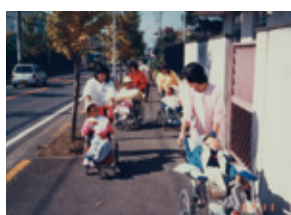
知的障害者通所更生施設「朋」