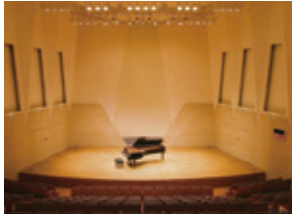
栄区民文化センター「リリス」