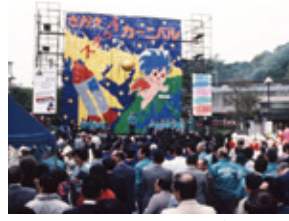
さかえステップカーニバル