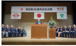
栄区制30周年記念式典