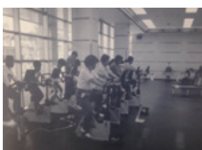
栄公会堂・栄スポーツセンター