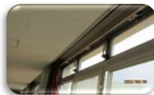
廊下回廊の排煙窓～時々開閉確認しています