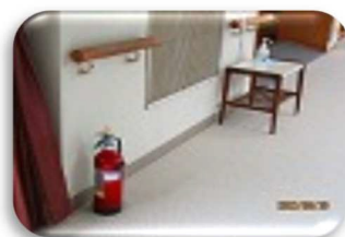
廊下にある消火器（全6本）