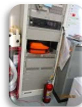
事務室には AED が置かれています