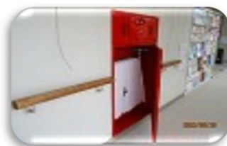
消火設備開けて使えます