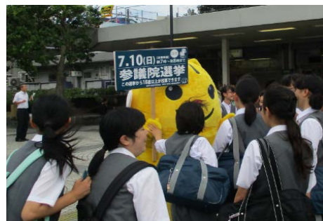
7月 参院選 街頭啓発