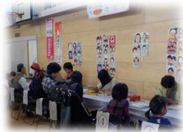
平成27年度区民まつりの様子