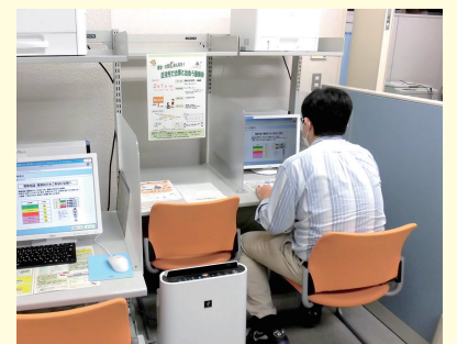
自分で調べすることもできます