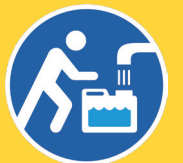
災害時給水所のマーク

飲料水は、人間が生きていくために欠かせないもの。在宅避難の備えとして飲料水を備蓄していても、それがなくなってしまったら…と困ってしまいますよね。災害などで断水したときには、地域の皆さん、横浜市管工事協同組合、水道局職員などが協力して「災害時給水所」を開設します。