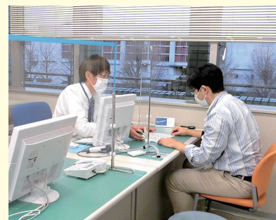
相談員と直接相談

区役所内に設置されているジョブスポットを活用しながら、ハローワークと連携して就職活動をサポートします。