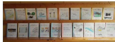
〔子どもたちの図鑑〕