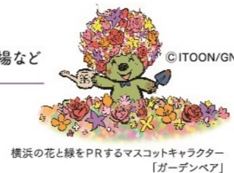
横浜の花と緑をPRするマスコットキャラクター「ガーデンベア」

開催期間：(春) 2024年3月23日（土）～5月6日（月） (秋) 2024年9月中旬～10月中旬（予定） 開催場所：旭区上白根町 1425-4（よこはま動物園ズーラシア隣接）