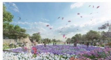
(公社)2027年国際園芸博覧会協会より提供