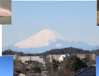
公園の近くで見える富士山