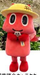
公園愛護会キャラクター あいごぼん