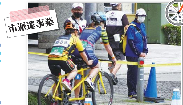
ワールドトライアスロンシリーズ横浜大会