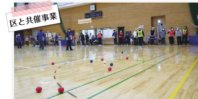
パラフェスタ♥さかえ「ふれあいポッチャ大会」