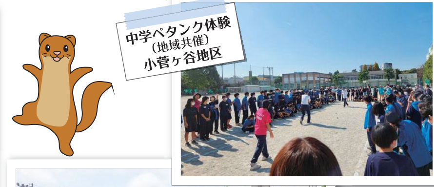
中学バタンク体験 (地域共催) 小菅ヶ谷地区