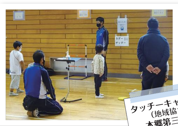
タッチーキャラバン (地域協力) 本郷第三地区