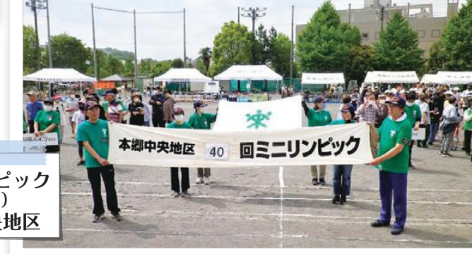
ミニリンピック (主催) 本郷中央地区