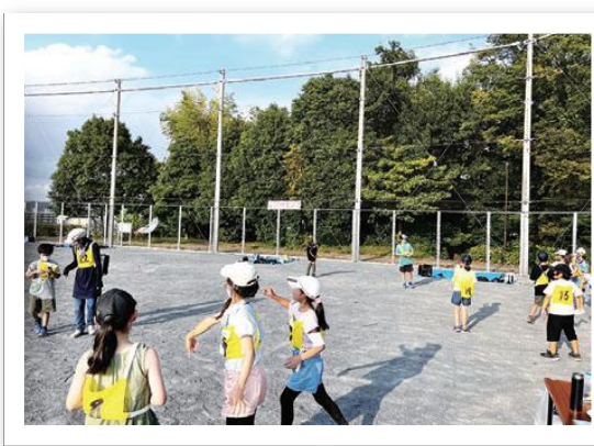
笠間デイキャンプの紙血飛行機 (地域協力) 笠間地区