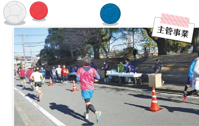
栄区民ロードレース大会