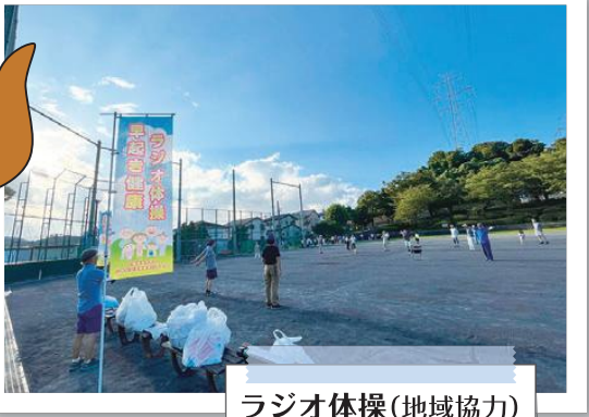
ラジオ体操(地域協力) 上郷西地区