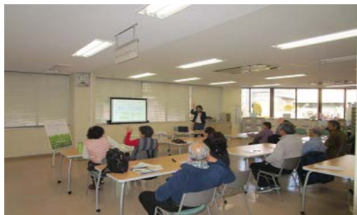
サロンの開催風景