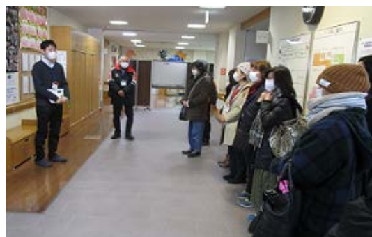
ケアプラザの説明に耳を傾ける受講生たち

平成30年度の「地域デビュー講座」も区民の皆様にお役にたてる内容で講座内容を充実して開講してまいります。地域活動の活性化に関心をお持ちの皆様、ご参加をお待ちしています。