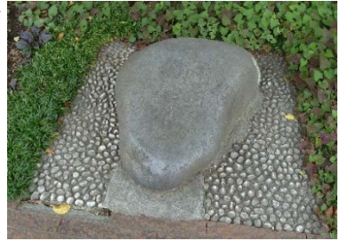
①「光明寺」の境内。重さは約 130 キロ