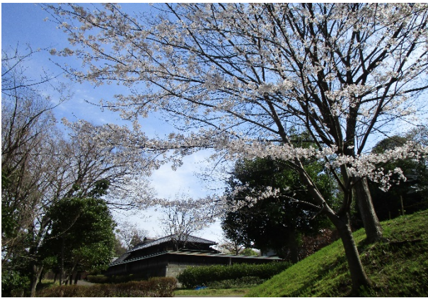
本郷ふじやま公園 栄区鍛冶ヶ谷1-20(中野町バス停下車徒歩9分)