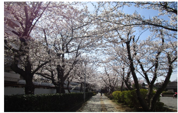
あーすぷらざと市営住宅の間にある桜並木 200mほどの歩行者専用道路に、桜が咲き乱れます。

★「ぷらっとギャラリー」★ さかえ区民活動センター「ぷらっと栄」の中にあるギャラリーです。「登録団体」や「まちの名人・達人」の作品を紹介しています。