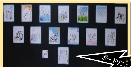
「書道サークルきらら」