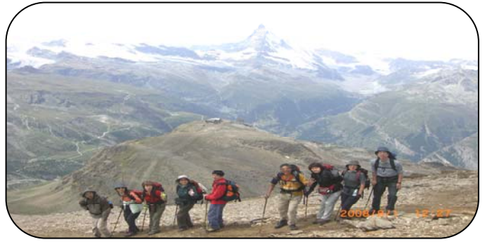
マッターホルンをバックにヴァリス山郡に行く

漫歩会さんは7月下旬から8月初めにかけてヨーロッパ(スイス)アルプスの山旅を堪能されたそうです。おめでとうございます。