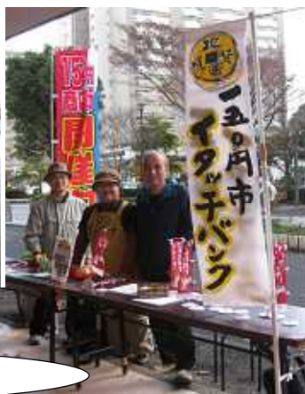
イタッチバンクで地域通貨を購入

「栄区の地域経済の活性化を目指す商品券として、また“ありがとう”という気持ちを伝えたい時のお礼として使ってもらうことで助け合いや支え合いがあふれるまちづくりをしていきたい。色々な団体と関わりながら、地域通貨を浸透させていきたい。」と話すメンバーたち。一緒に活動してくれる仲間を募集しています。