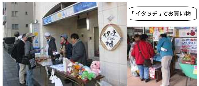
「イタッチ」でお買い物