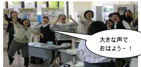
大きな声で おはよう～!

無理せず焦らず、でも好奇心と成長する意欲を忘れずに、これからの日々を過ごしていこうと改めて思っています。帰りの電車で懐かしい景色を見ているうちに、のびのびした笑顔になりました。(川瀬)