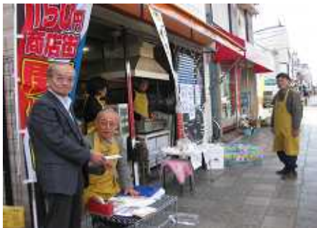
栄区全体に広めていきたい！