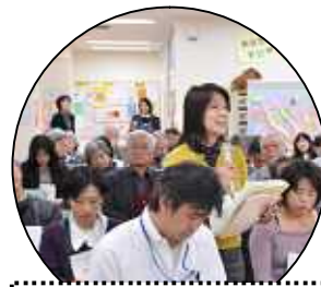
会場からは熱い質問も...

地域で活動を始めようとする時は、目標とすべき「公共」について徹底して学習を行い、知識を基盤にして共通の理解を広げていくことが必要になる。逆に言えば、「地域活動」とはそこまで“深み”も“やりがい”もあるものということではないだろうか。