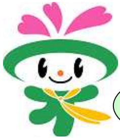
マスケットキャラクター くーみん