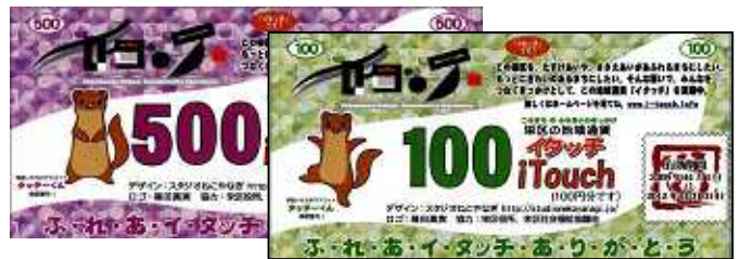
(栄区限定の商品券)

栄警察署向かいにある「やきとりの虎屋」のスペースを、週に1回(火曜または金曜の午後2時から4時)「イタッチ」を広く周知するための情報拠点として活用し、地域通貨の換金や販売、協力店の情報提供を行っています。栄区で使える店は70店舗余りと利用できる協力店も増えています。イタッチ協力店で100円、500円分として買い物ができます。協力店の載ったマップもあります。店のシャッターに描かれたイタチ・トラ・ニワトリの絵を目印に行ってみては！