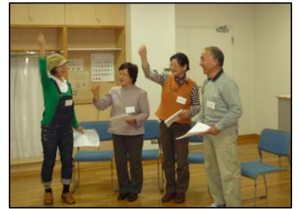
寸劇発表をする皆さん

この日は最終回で寸劇の発表会。各グループとも最終リハーサルのため早くから来て練習していました。本番ではそれぞれ場面設定、台本作りをし、みんなで練習した成果を堂々と発表しました。その表情はとても楽しそうでした。最後は短い英語のリーディングをしました。“発音は本当に大切、正しい発音で音読を繰り返すことでリスニングの力も養われます”というアドバイスをいただき終了しました。