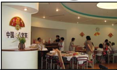
中国茶を楽しむ講座 開催