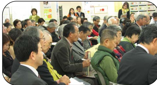
22年度 交流会の様子