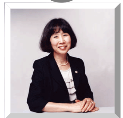
講師プロフィール