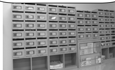
小 ボ ッ ク ス 6 6 個