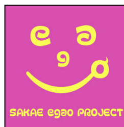
ロゴマークの「egao」デザイン

2月12日(日)のさかえ区民活動フェアでは、「さかえ de ピクニック」と「さかえ de つかいたい」の2作品を展示・販売します。私たちの活動のつながりの成果をぜひご覧ください。