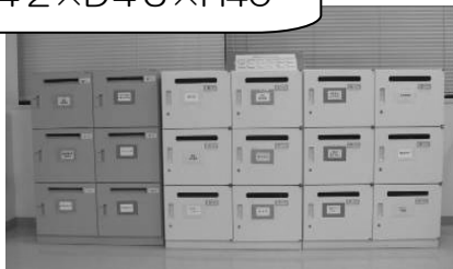
大 ボ ッ ク ス 1 8 個