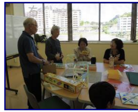
第2回 アロマオイルで作る夏の 冷んやりジェル・ペー パークラフト・夏のキラキ ラドームの様子