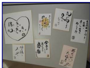
第3回 かみしばい公演の様子とフラワー アレンジメント・ことばと自分を 楽しくする筆文字アートの作品