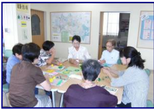
第1回 折り紙手芸の様子とクレイ アート・パステル画の作品