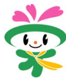
マスコットキャラクター くーみん