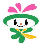
マスコットキャラクター くーみん

詳しくは「ぷらっと栄」のホームページをご覧くださいか、「ぷらっと栄」で案内を配布していますのでお問い合わせください。