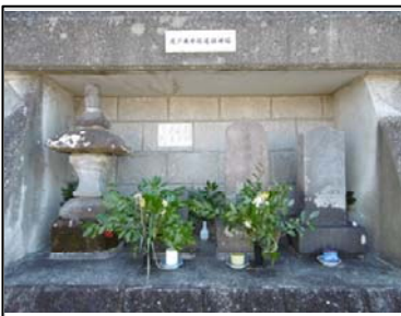
⑨渡戸庚申塔・道祖神塔

小菅ヶ谷町829より平成12年12月に下組講中により遍座された。庚申供養塔(天保3年(1738年)8月)、