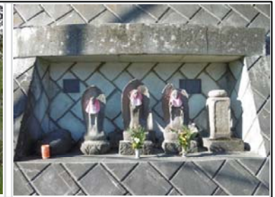
④鎌倉古道木曾の石仏

ら戻ってきたお礼に野の花を供えた。この辺りを花立と呼んでいた。境内には「なんじゃもんじゃ」という樹齢500年以上のクロガネモチの木がある。34段。