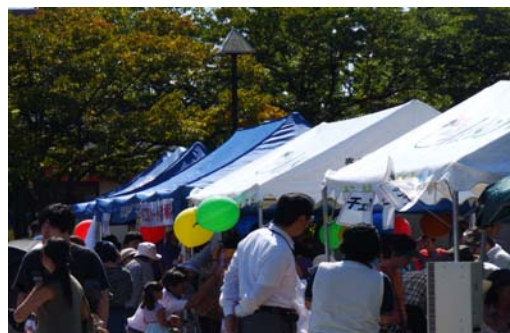
▲福祉フェスタの様子

平成 27 年度で第 7 回目、区社協 高齢者支援分科会会員である区内高齢者施設が主体となり、地域住民に区内の福祉施設を知ってもらうこと、地域住民との交流を目的として周知、啓発活動を実施しています。