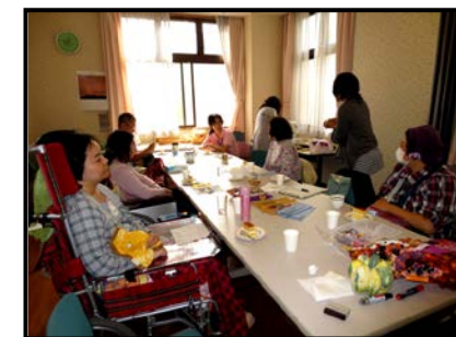
みんなでハロウィンパーティー