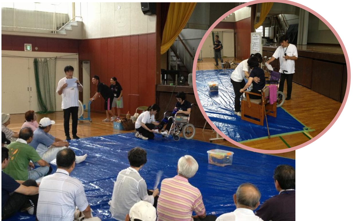
9月8日、庄戸中学校地域防災拠点訓練の様子。野七里地域ケアプラザ、クロスハート野七里の協力により、車椅子やトイレ介助の訓練、認知症の方への接し方の講義なども行われました。