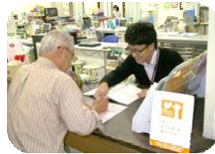
ボランティアセンター 窓口での相談の様子

栄区社会福祉協議会ボランティアセンターでは、ボランティア活動を始めようとしている人を応援しています。コーディネーターが相談に乗り、ボランティアの登録・受付、活動の紹介を行っています。興味を持ったら、それが活動への第一歩です！お気軽にお問い合わせください。