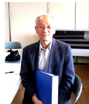
本郷第三地区社会福祉協議会 本多会長

「本郷第三地区支えあいネットワーク」や「上郷東地区見守りネットワーク」で活用されています。