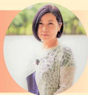
講師 かけはし くみこ 梯 久美子 氏 (ノンフィクション作家)