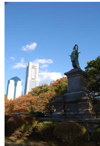
みなとみらい地区ごしに 開港の地を望む、井伊掃部頭像