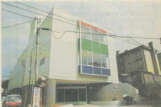
「西区地域活動ホーム」(写真は建物完成直後)