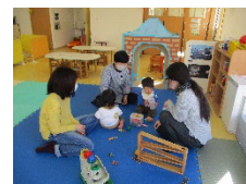
地域の親子に向けた 育児支援の様子

・地域の中で学齢期のこどもたちが健やかに成長できるよう、小中学生への危機管理教室や中学校いのちの教室、放課後事業に携わる職員の人材育成研修、西前小学校における朝の居場所づくりモデル事業などの取組を進めます。