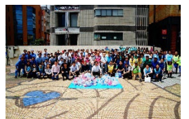
横浜駅をきれいに！キャンペーン (横浜駅周辺での清掃活動)