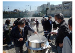
稲荷台小学校地域防災拠点 訓練の様子