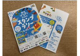
商店街を巡る スタンプラリー冊子