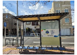
区庁舎前のバス停看板で PR