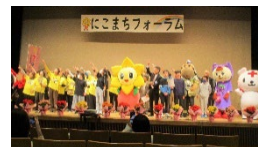
にこまちフォーラム

・地域活動の充実につなげるため、「にこまちフォーラム」を開催します。また、小学校への出前講座等の「子ども向け啓発」を通じ、子どもたちやその親世代の地域参加を促し、新たな担い手の発掘・育成に取り組めます。