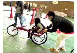
レーシング用車いす 試乗体験の様子