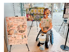
障害者施設利用者の作品展示

・施設や病院から地域生活への移行や住宅の確保に向け、一人暮らしを体験できる生活体験事業を継続し、並行して居住支援関係機関等に働きかけを行います。