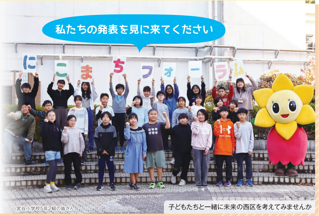
宮谷小学校5年2組の皆さん

西区につながる全ての人が力を合わせて、誰もが「にこやか、しあわせに、くらせるまちを目指す」にこまちプラン。その新しい計画が、令和8年度からスタートします。 今回の「にこまちフォーラム」は、新プランの発表や地域の小学生による発表など、見どころ満載です。