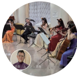
演奏も司会のお話もお楽しみください

📅 3月7日(土) 13時～14時30分 📍 西前小学校コミュニティハウス (中央2-27-7) 👤 先着35人 💰 200円 📞 2月11日(水・祝)～ 来館または電話 📍 西前小学校コミュニティハウス ☎️ 311-8043