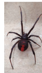
セアカゴケグモ(背面)