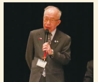
各地区の代表者から、地域の課題や解決に向けたアイデアを発表いただきます