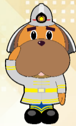
横浜市消防局 マスコットキャラクター 「ハマくん」