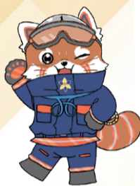
西消防署 マスコットキャラクター 「にっしーパンダ」