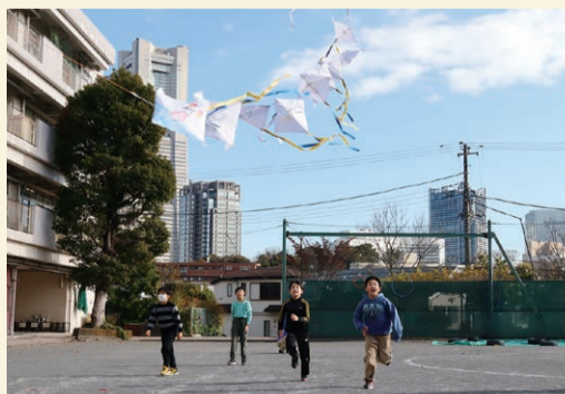
戸部小学校4年1組の活動