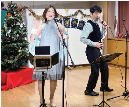
音楽を通じて楽しい時間を過ごしましょう

心に不調を抱える人の体験談を聞いたり、一緒に歌ったりして交流しましょう 🕒 12月20日(土)13時30分～15時 👤 先着30人 💵 1,000円 📄 11月11日(火)～ 来館(10時～)または電話(13時～)