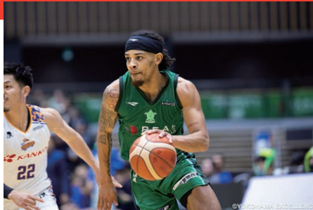
躍動感あふれるプレーを現地でお楽しみください

A 会場はエンターテインメント空間としても魅力たっぷり。マスコットやチアのダンス、グルメ、子ども向けの遊び場など、世代を問わず楽しめる工夫が満載です。