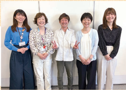
西区の生活支援コーディネーターの皆さん

市内の地域活動や、自分らしい暮らしの選び方について調べられます。西区内での社会参加を通じた「つながり」の様子を紹介したPR動画や、地域活動に取り組む皆さんのインタビューもぜひご覧ください。