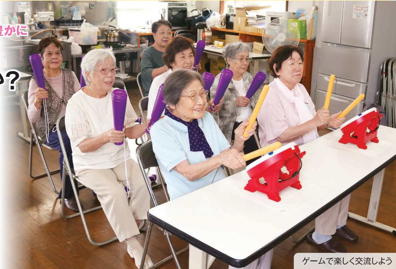
ゲームで楽しく交流しよう