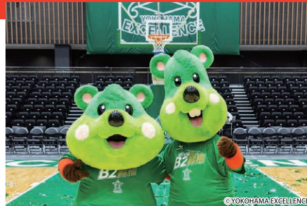
公式マスコット「Pick」と「Roll」と一緒に応援しよう