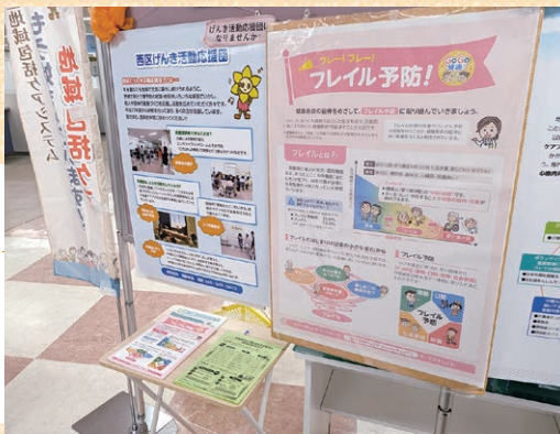
介護予防や認知症対策などを知ることができます

期間・場所 ● 11月26日(水)～12月14日(日) 中央図書館(老松町1) ● 12月15日(月)～26日(金) 区役所1階(中央1-5-10) 問合せ 地域包括ケア推進担当 Tel 320-8410 fax 290-3422