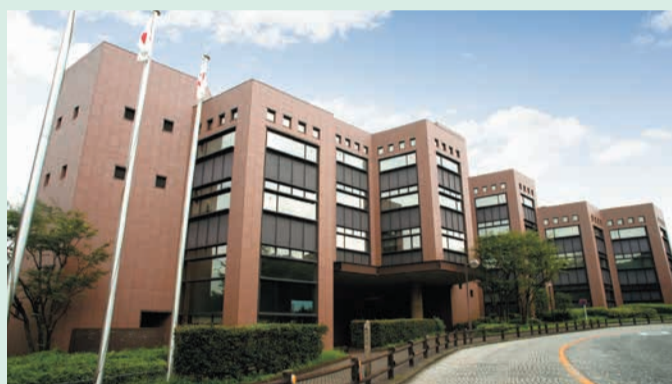
地下3階地上5階建の大きな施設です