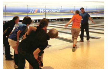
インストラクターが基本から教えます

●健康維持のためのボウリング体験会 🕒11月6日、13日、20日、27日(金) 15時～16時30分 全4回 📍ハマボール(北幸2-2-1) 🧑区内在住・在勤で初めて参加する人 先着20人 💰2,000円(講義・実技代・貸靴代含む) 🎒運動しやすい服装 📄10月12日(月)～ 直接来館(ハマボールイース8階)、電話またはFAX 🗨️西区スポーツ協会ボウリング部 相澤 ☎️311-6700 📠311-6712