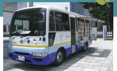
子ども大人も楽しめるようにさまざまな本を運んでいます