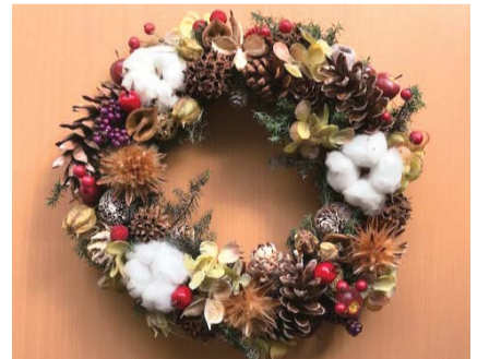
自由にデコレーションしよう

クリスマス気分を盛り上げるリースを作ります 📅11月21日(土) 10時～12時 👤先着5人 ¥1,800円 📝10月21日(水)～ 直接来館または電話(3日以内に費用持参) ※申込みは1人1枠に限ります