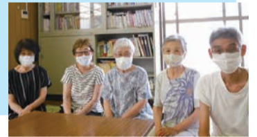
県営藤棚アパート自治会のみなさん

以前は中央図書館に自分で借りに行っていたのですが、今はこの文庫を利用しています。今まで興味のなかった分野もいろいろと読むようになりました。本を選んで借りた後、係の人とおしゃべりするの楽しいです。