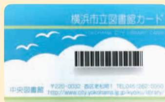
このカードで1人6冊、2週間まで借りられます(カードは5年ごとに更新)