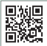
ツイッターはこちら