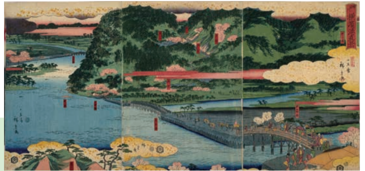
神名川横浜港真景

回答 ● 東海道神奈川宿の神奈川台から対岸を見た眺望のこと ● 八景の撰定時期・撰定者は不明 ● 参考文献は『ヨコハマ文学散歩 第44回』(横浜文芸懇話会1997.10)や… ● 当時の様子を伝える古地図や絵図は… など、お答えします。