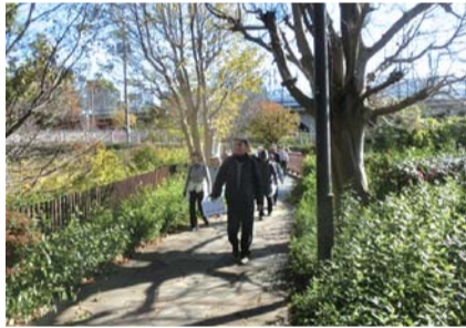
距離を保って歩きます

～お散歩講座～ 火薬工場跡地のたちばなの丘公園や、横浜の自然豊かな公園を散策します 📅11月5日(木) 9時30分～15時 ※相鉄線鶴ヶ峰駅集合。荒天時は中止またはコース変更の場合あり 予備日:11月11日(水) 👤成人 先着10人 ¥200円 📝10月13日(火)～ 直接来館(10時～)または電話(13時～)