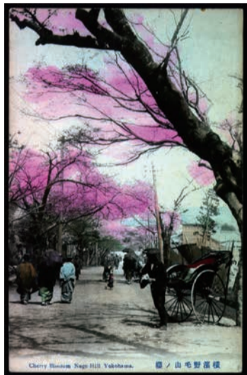
「横浜野毛山の桜」絵葉書