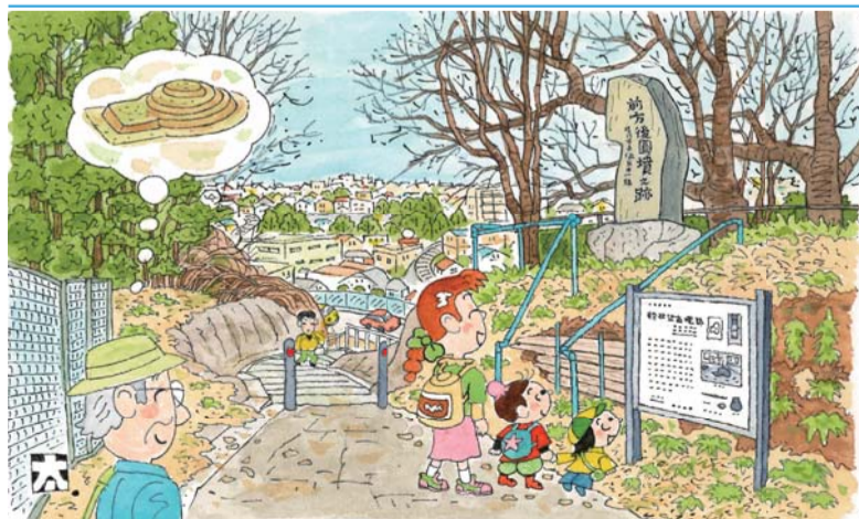
題字・絵と文 鈴木太郎

西区は縄文時代からの大きな貝塚が残っていて、大昔から海に近くて、住みやすい所だったのだ。