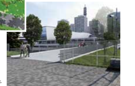
(仮称)臨港パークデッキ