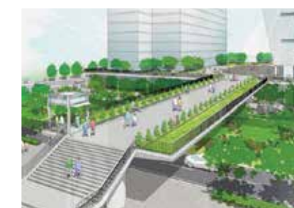
(仮称)臨港幹線キング軸デッキ

みなとみらい21の主要な歩行者軸であるキング軸。2つのデッキで臨港パークまで歩行者ルートがつながります。