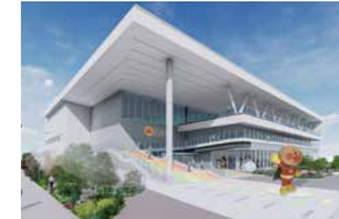
(c)やなせたかし/フレーベル館・TMS・NTV