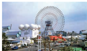
横浜博覧会 開催当時

横浜夜景を彩る大観覧車コスモクロック21は、横浜博覧会の展示施設として作られたことが始まりです。来場者から大変好評だったため、博覧会終了後も存続が決まりました。その後、みなとみらい地区の開発(ホテルや高層ビル建設など)にあわせ、1999(平成11)年に川を挟んだ対岸に移設されて現在に至ります。