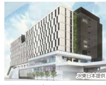
JR横浜鶴屋町ビル(商業施設、スポーツクラブ、保育所など)