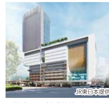
JR横浜タワー(商業施設、多目的エンターテインメントなど)

JR横浜タワーは隣接する施設とつながり、横浜駅を中心とした歩行者動線がさらに充実。