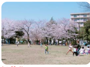
社宮司公園(南浅間町25) 桜に囲まれた大きな原っぱが広がります。