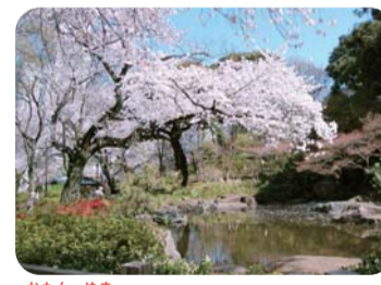
掃部山公園(紅葉ヶ丘57) お花見でにぎわう広場から少し足を延ばすと、池の周りの落ち着いた風情の桜が楽しめます。