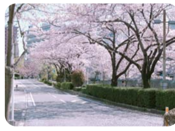
石崎川プロムナード(平沼1丁目～2丁目付近) 川に映る桜も一緒に楽しめます。梅がさき香崎橋の上は絶好の撮影スポット。