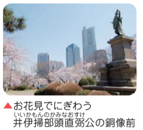
▲お花見でにぎわう いいがもんのがみなおすけ 井伊掃部頭直弼公の銅像前

Topics シドモア桜(野毛山公園内 野毛山配水池) 日本を愛した米国人紀行作家、エライザ・シドモア(1856～1928)。彼女が尽力したワシントン・ボトマック河畔への桜の植樹から100周年を迎えた平成22年、日本に里帰りした桜の1本が野毛山配水池に植えられました。 シドモア桜 咲くのが楽しみです