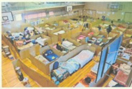
仕切りのある避難所

まとめ 利点 、 欠点 、 設置 、 管理 など色々見てきました。そこでダンボールの仕切りは、被災地での生活をより 快適 にし、 プライバシーを確保するための有効な手段 であることが明らかになりました。なので避難所ではダンボールの仕切りを使うと 安心して過ごす ことができると思いました。