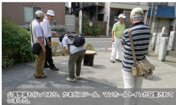
公園整備もっており、かまどスツール、マンホールトイレが設置されていました。