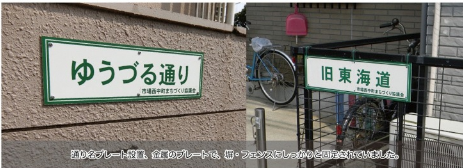
通り名プレート設置、金属のプレートで、柵・フェンスにしっかりと固定されていました。