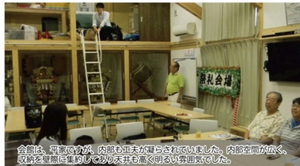
会館は、平家ですが、内部も工夫が凝らされていました。内部空間が広く、収納を壁際に集約しており天井も高く明るい雰囲気でした。