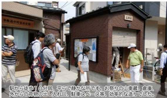
駅から徒歩10分弱、平らで静かな所です。お祭りの山車蔵、倉庫、外からの荷物の出し入れ口、駐車スペース等、効率的な造りでした。