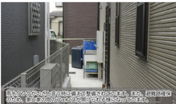
雨水タンクがいざと言う時に備えて整備されています。また、避難路確保のため、家と家の間のフェンスが開けられる様になっています。