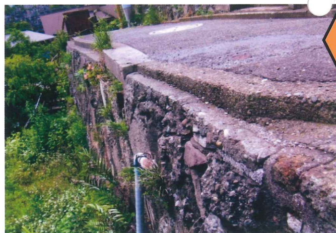
◇危険ながけ地（道路）