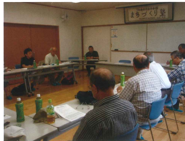
◇下和泉住宅地区との懇談会

また要援護者（お年寄り、障がい者など）の名簿や支援の手順と安否確認の連絡網などの準備により安全、安心な防災に強いまちになるよう、進めますので、皆さま方のご理解とご協力をお願いします。