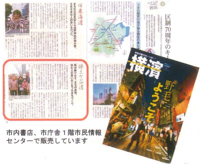
市内書店、市庁舎1階市民情報センターで販売しています

こういう形で東久保町の防災まちづくりの活動がどんどん紹介され、広まっていくといいですね。 (西区役所 相馬)