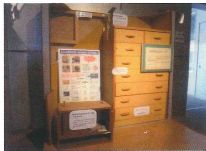
◇家具転倒防止の器具展示