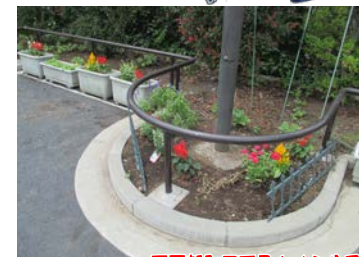
西戸部町三丁目さくら公園