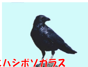
ハシフトガラスとハシボソガラス