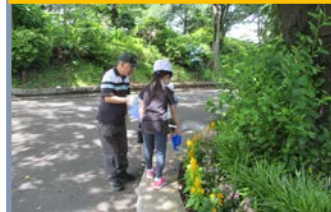
会話をしながら一緒に水やり