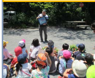
写真に釘付けの児童達