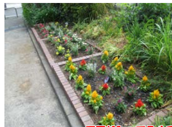
西戸部町二丁目公園