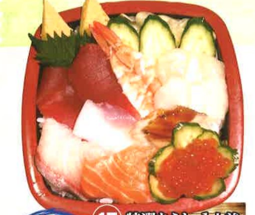
特選 ちらし 17 特選ちらし 1人前 1,026円 (税抜950円)