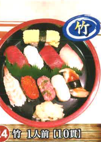
24 竹 1人前 [10貫] 950円 (税抜880円) 赤身・かんぱち・ホタテ・イカ・寿司エビ・いくら・ネギトロ・穴子・玉子