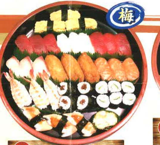
12 梅 3人前 [27貫+巻物2本] 2,484円 (税抜2,300円) 赤身・イカ・サーモン・寿司エビ・穴子・ネギトロ・いなり・玉子・かっぱ巻・かつぱ巻