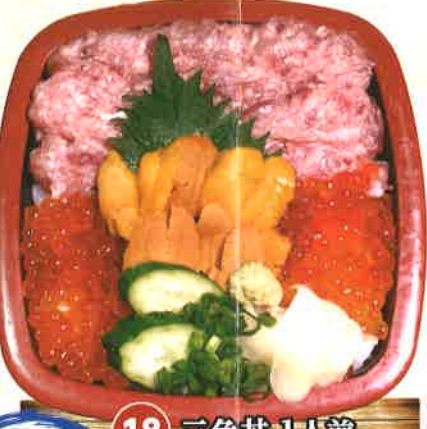
三色丼 18 三色丼 1人前 1,728円 (税抜1,600円)