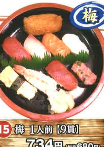
15 梅 1人前 [9貫] 734円 (税抜680円) 赤身・かんぱち・サーモン・イカ・寿司エビ・ねぎとろ・いなり・玉子