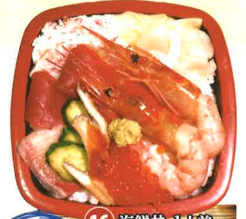
海鮮丼 16 海鮮丼 1人前 1,512円 (税抜1,400円)