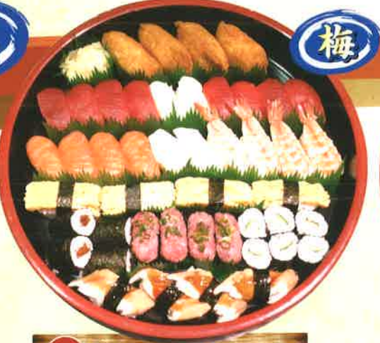
11 梅 4人前 [36貫+巻物2本] 3,024円 (税抜2,800円) 赤身・イカ・サーモン・寿司エビ・穴子・ネギトロ・いなり・玉子・かっぱ巻・かつぱ巻