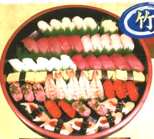
7 竹 5人前 [51貫] 4,644円 (税抜4,300円) 赤身・かんぱち・ホタテ・イカ・寿司エビ・いくら・ネギトロ・穴子・玉子