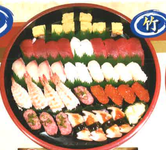
8 竹 4人前 [40貫] 3,780円 (税抜3,500円) 赤身・かんぱち・ホタテ・イカ・寿司エビ・いくら・ネギトロ・穴子・玉子