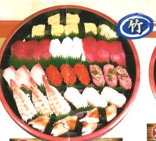
9 竹 3人前 [30貫] 2,808円 (税抜2,600円) 赤身・かんぱち・ホタテ・イカ・寿司エビ・いくら・ネギトロ・穴子・玉子