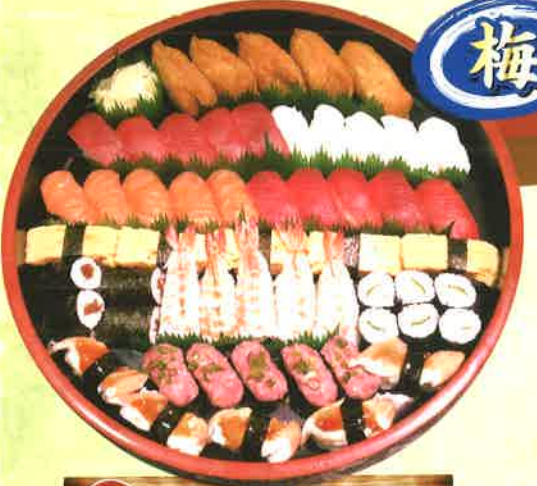
10 梅 5人前 [45貫+巻物2本] 3,672円 (税抜3,400円) 赤身・イカ・サーモン・寿司エビ・穴子・ネギトロ・いなり・玉子・かっぱ巻・かつぱ巻