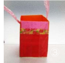
牛乳パックに紙をはってひもをつけた物