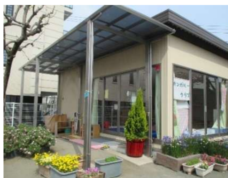
園庭の一角にある支援室 “カンガルーむ”