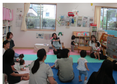
“おはなし会” わらべうたでふれあい遊びも。

【お問い合わせ・お申込み】 横浜市南浅間保育園 (西区育児支援センター園) 横浜市西区南浅間町23-3 ☎045-312-0942