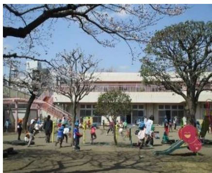
園庭でたくさん遊べます。