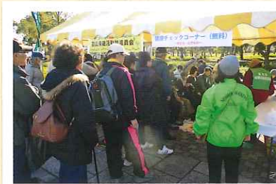
ハマのウォーキングフェスティバル

血管年齢・骨密度測定に 500名を超える参加者 ※血管年齢:409名、骨密度:190名