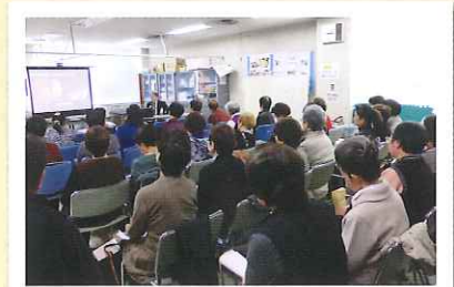
胃がん検診普及啓発研修会

三ツ沢ハイタウンクリニックの先生から 胃がんについてのお話を伺い、 検診受診の大切さを実感